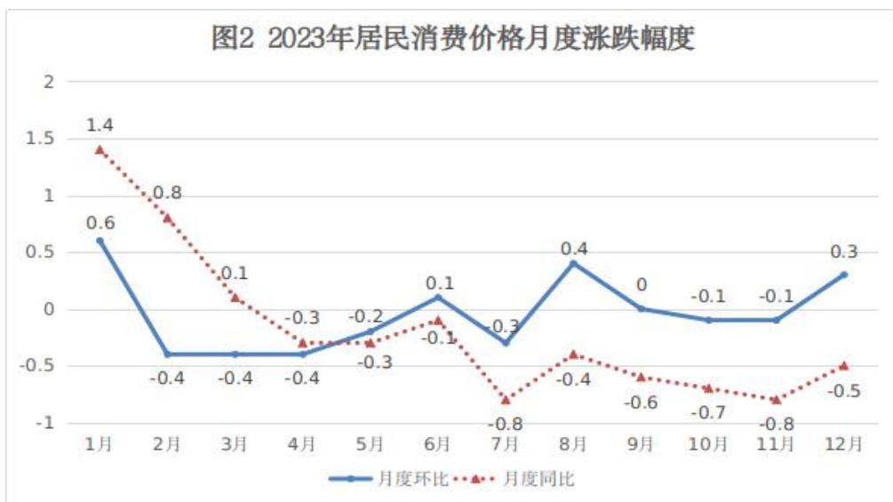
表 1 2023 年聊城市居民消费价格指数